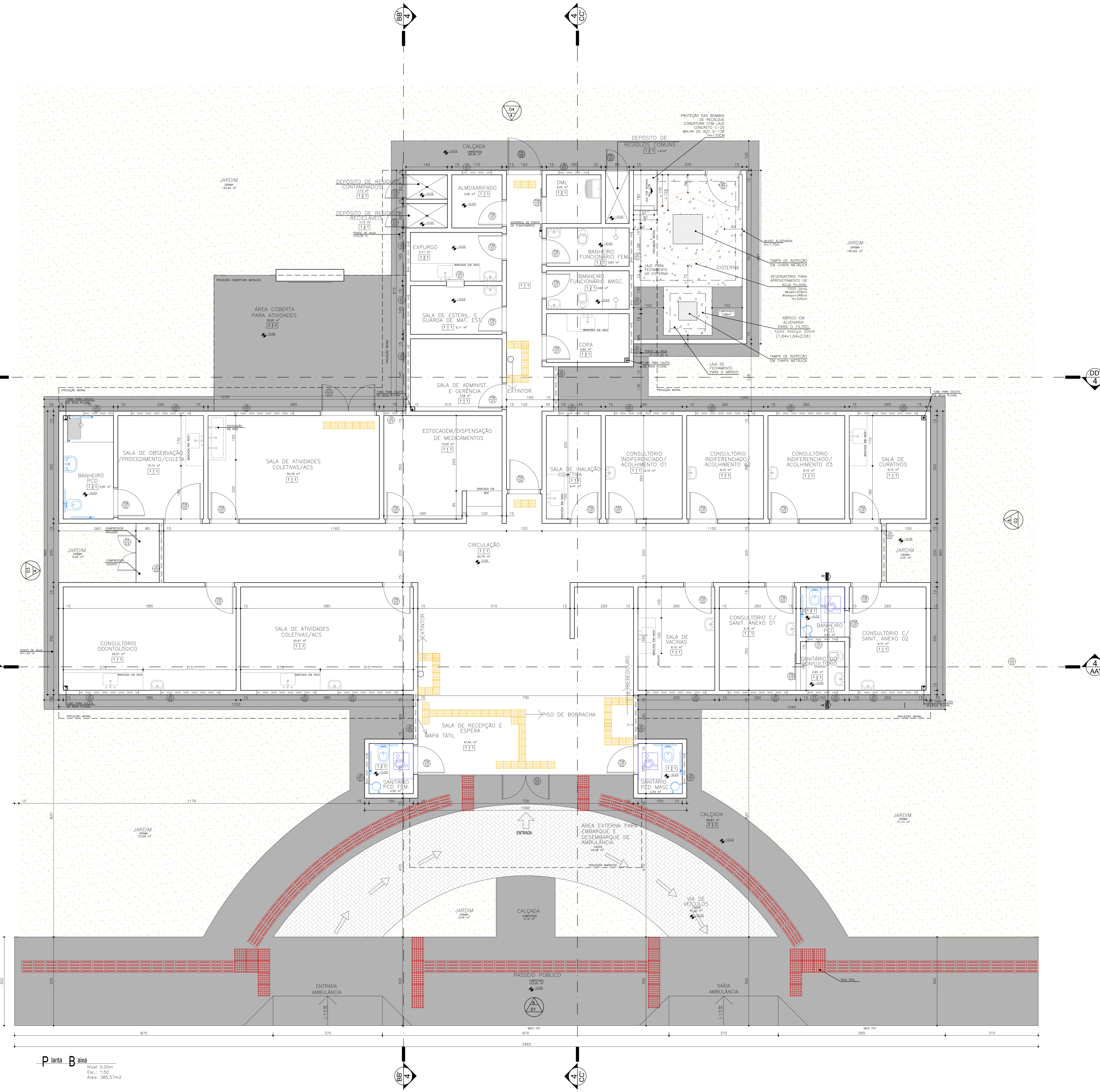
Planta Baixa Nível: 0,00m Esc.: 1:50 Área: 385,57m 2